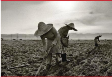
KONFERENCË NDERKOMBËTARE SHKENCORE