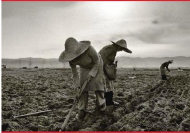
KONFERENCË NDERKOMBËTARE SHKENCORE