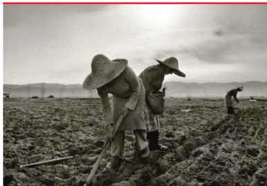
KONFERENCË NDERKOMBËTARE SHKENCORE